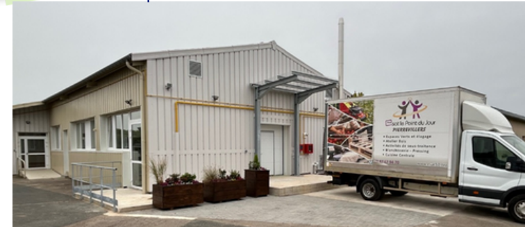
Locaux de la nouvelle blanchisserie

Elle offrira ainsi de nouvelles opportunités de formation, de montée en compétences et de valorisation du travail accompli au sein de l'ESAT. Cette réalisation est entièrement financée par nos fonds associatifs.