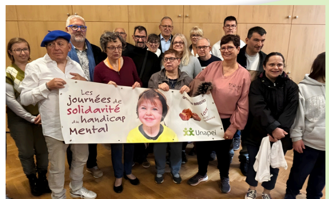
Remise de la Brioche au président du Conseil départemental

Nous vous donnons rendez-vous en octobre 2026 pour la prochaine édition.