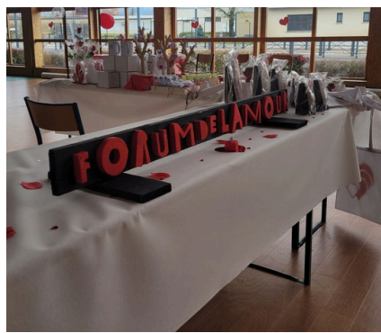
Confections réalisées par les jeunes de l'IMPRO