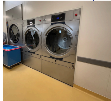
Machines à laver industrielles