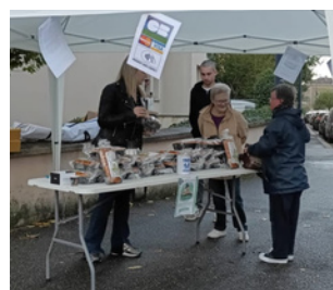
Stand du SAVS à Rombas

Derrière chaque brioche il y a le témoignage de notre mouvement parental et de sa volonté d'améliorer sans cesse l'accueil et l'accompagnement de nos usagers.