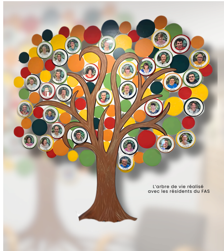
L'arbre de vie réalisé avec les résidents du FAS

On nous interpelle régulièrement sur l'expression « Enfants Inadaptés » qualificatif qui, pour beaucoup d'entre nous, apparaît dépassé.