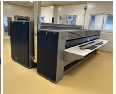
Machines à repasser